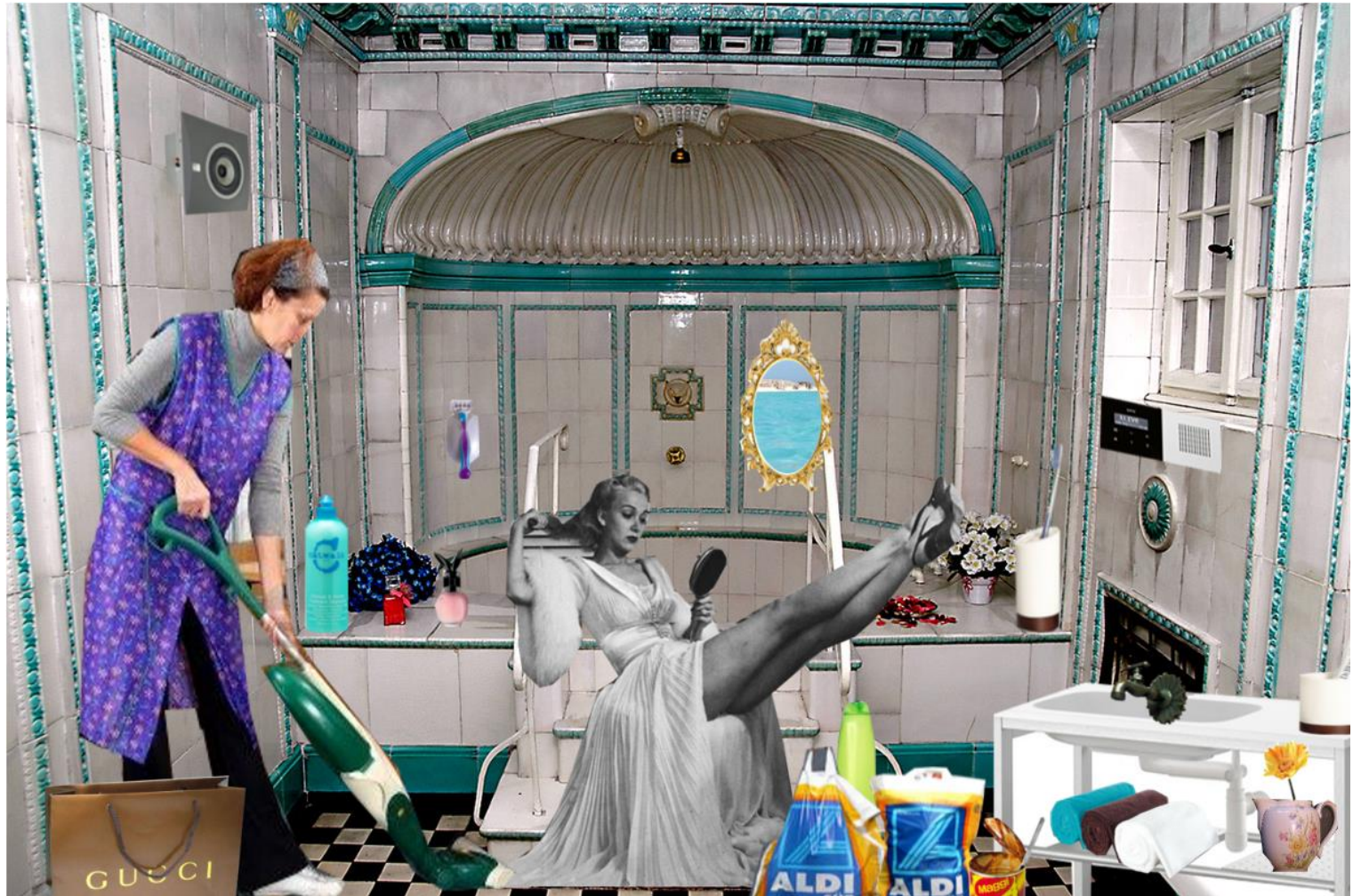
Collage - Bezug nehmend auf das Werk von Richard Hamilton der POP ART : "Just what is it that makes today's lives so different so..."